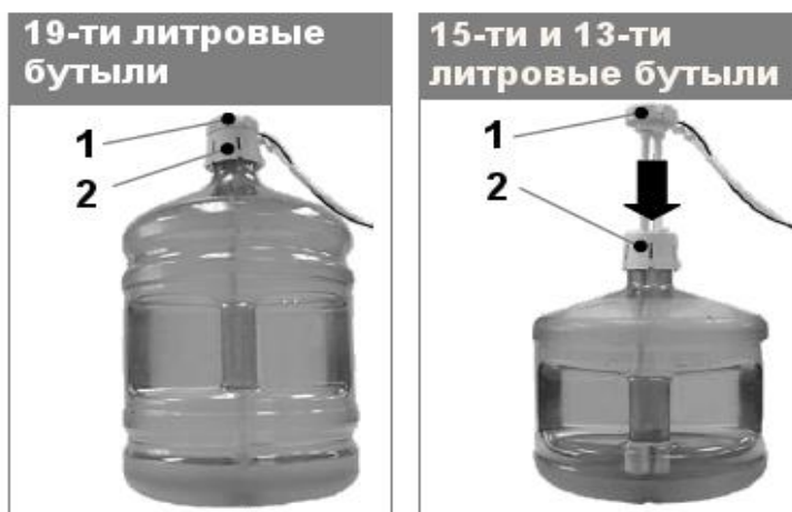
Рис.2 Установка сифона на бутылки с водой